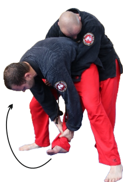
CHWYTEM ZA PODUDZIE